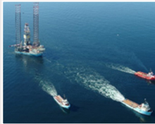
ديسمبر 2022 انتهاء عمل منصة الحفر