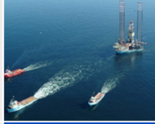
أغسطس 2022 بدء عمل منصة الحفر