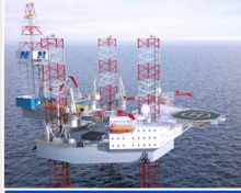
أغسطس إلى أكتوبر 2022 أنشطة الحفر